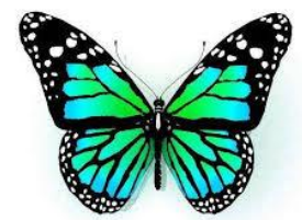
motyl butterfly [bateflaj]