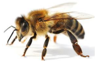
pszczola bee [bii]