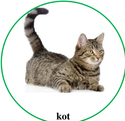
kot cat [kaat]