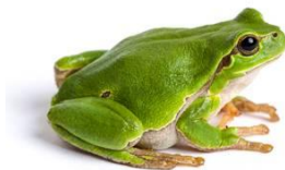
żaba frog [frog]