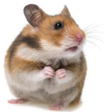
chomik hamster [hamste]