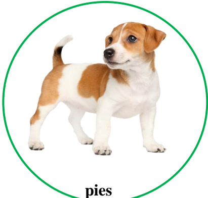
pies dog [dog]