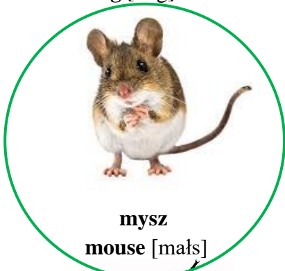
mysz mouse [małs]