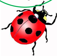
biedronka ladybird [lejdibyrd]