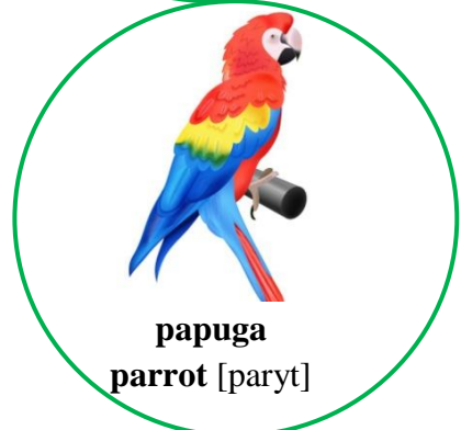
papuga parrot [paryt]