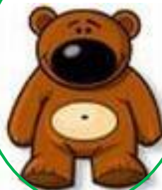
teddy bear - miś