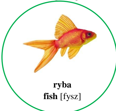
ryba fish [fysz]