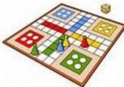
board game gra planszowa